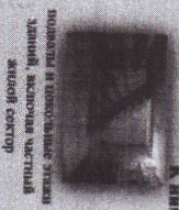
подвалы в помещениях зданий, включая частный жилой сектор